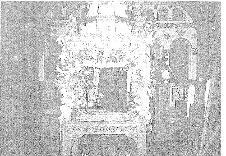
Ο Επιτάφιος της ενορίας Γέννησης Χριστού Κανδύλας.