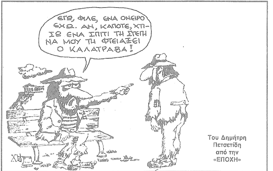
Του Δημήτρη Πετσετίδη από την «ΕΠΟΧΗ»