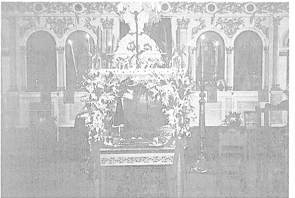
Μεγάλη Παρασκευή 2004. Ο Επιτάφιος της ενορίας Ταξιαρχών Κανδύλας.