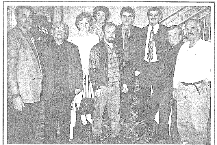
Από την επίσκεψη του Δημάρχου στις ΗΠΑ.

Αγαπητοί μου Συμπατριώτες Εξωτερικού και Εσωτερικού, Θερμές Ευχές για χαρούμενα Καλά Χριστούγεννα. Το ΝΕΟΝ ΕΤΟΣ να σας φέρει χαρά και ευτυχία, οικογενειακή και προσωπική.