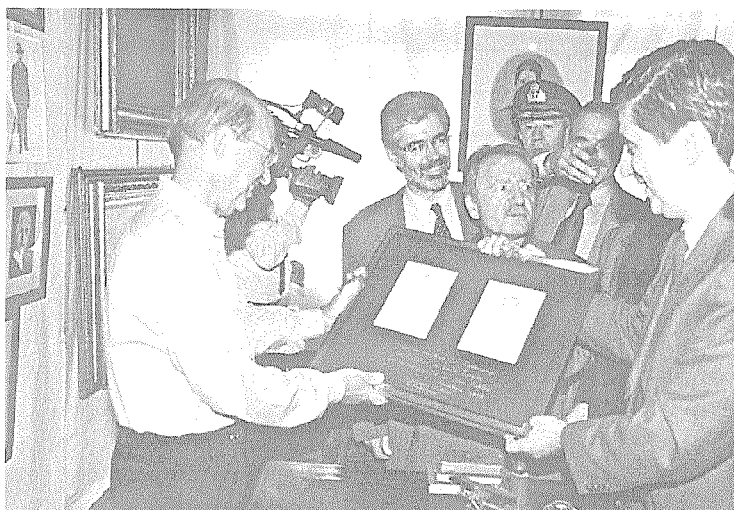
Από την επίσκεψη του πρωθυπουργού στο Μουσείο «Παπαναστασίου»

Ο Δήμαρχος Λεβιδίου και ο Αντιδήμαρχος επισκέφθηκε επί