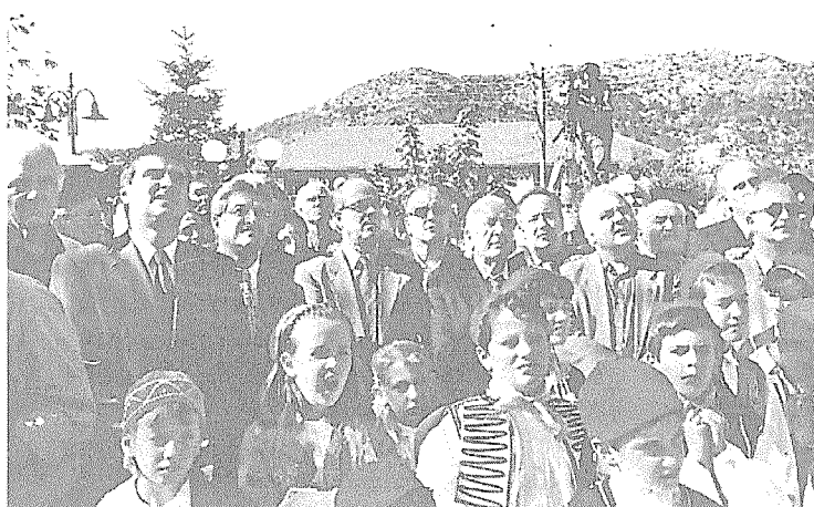
Στιγμιότυπο από την επίσκεψη του πρωθυπουργού στην Κανδύλα