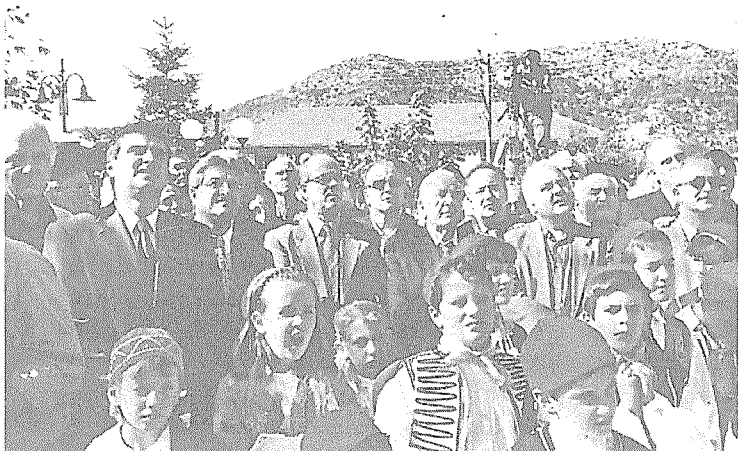
Στιγμιότυπο από την επίσκεψη του πρωθυπουργού στην Κανδύλα