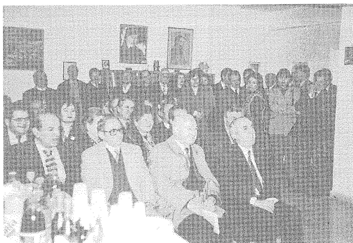
Ένα ακόμη στιγμιότυπο από την εκδήλωση.