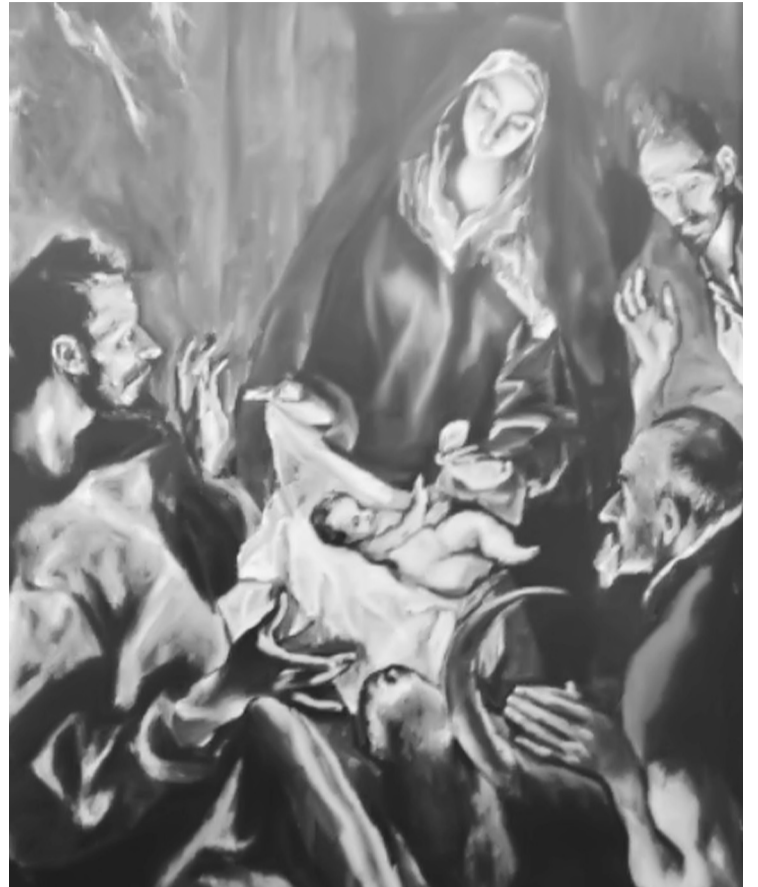
Δομήνικος Θεοτοκόπουλος (1564-1614) Μαδρίτη, Πράντο