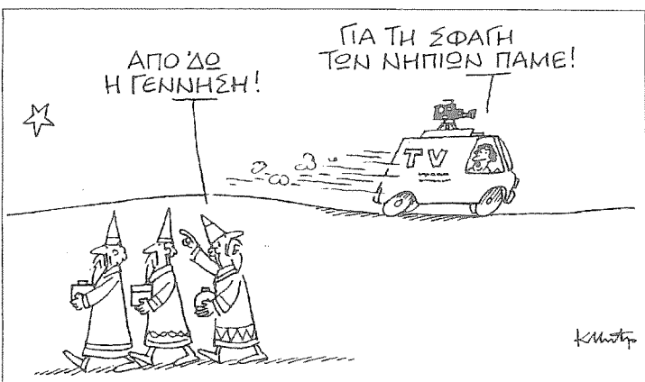
ΤΟΥ Κ. ΜΗΤΡΟΠΟΥΛΟΥ ΑΠΟ ΤΟ «ΒΗΜΑ»

Εύχονται σε όλα τα μέλη του Συλλόγου, σ' όλους τους συμπατριώτες και φίλους της Κανδύλλας, Καλά Χριστούγεννα και Ειρηνικό και Ευτυχισμένο το νέο έτος 1996.